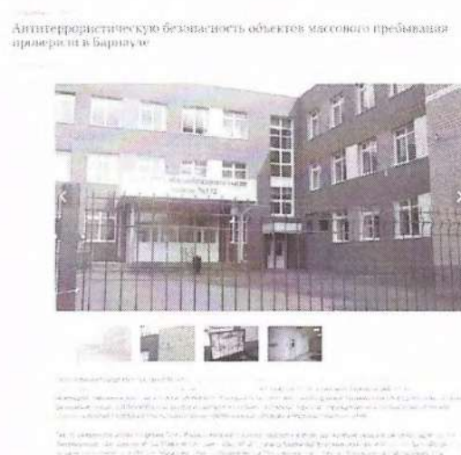
Рисунок 11– Информация о прошедшем мероприятии

Другой пример – мероприятие по мониторингу обеспечения антитеррористической безопасности объектов массового пребывания в г. Барнаул (см. рисунок 11).