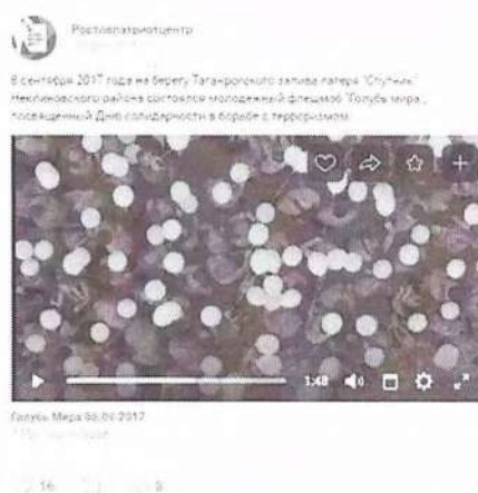
Рисунок 8 – Информация о прошедшем мероприятии в социальной сети «ВКонтакте»

Видеоматериал как один из результатов состоявшейся акции был распространен через отдельную публикацию (см. рисунок 8).