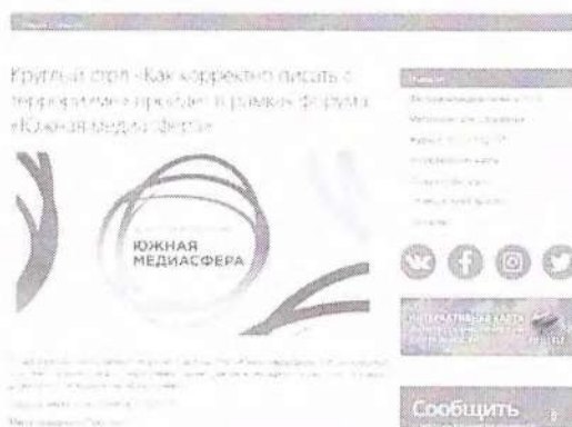
Рисунок 9 – Информация о предстоящем мероприятии

Данный пункт можно проиллюстрировать мероприятием – Круглый стол «Как корректно писать о терроризме», который прошел в рамках форума «Южная медиасфера» (см рисунок 9).